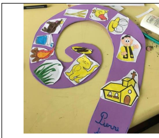
Figura 3 – Caracol da Parlenda

Atividade 8– Sarau de Parlendas - “cadê o toucinho que estava aqui”, “o doce mais doce”, “a casinha da vovó”, “a pedrinha”, para auxiliar na alfabetização e no aspecto da forma da linguagem, componente sonoro. E confecção em EVA em caracol com as imagens da parlenda “cadê o toucinho que estava aqui” (FIGURA 3). “A barata diz que tem” confecção com cd. (FIGURA 4). Após estas atividades foi realizado o sarau de parlendas, para esta atividade uma turma apresentou e a outra foi convidada para assistir. Foram apresentadas as quatro canções esta atividade teve como propósito desenvolver a escrita e oralidade.