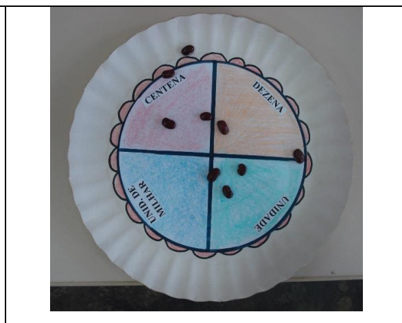
Figura 2 – Jogo dos Pratos