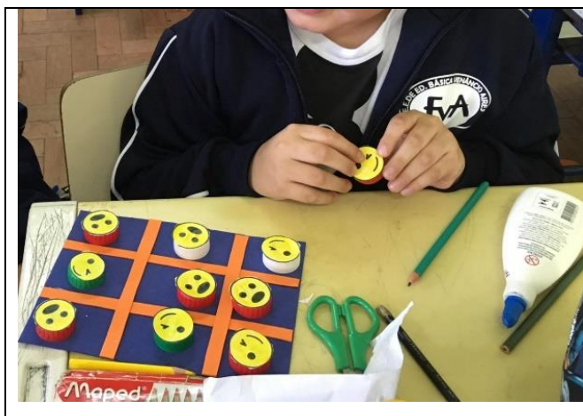
Figura 1 – Jogo da Velha

- Atividade 6 – Jogos matemático: a sucata como recurso - foi construída pelos alunos, com EVA, um jogo da velha e utilizou-se tampas de garrafa pet, para jogar (FIGURA 1). Também foi construído o “jogo dos pratos” para o aprendizado matemático (FIGURA 2).